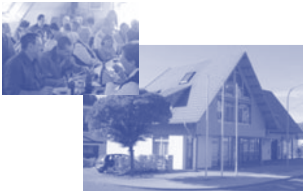
Fotos: Bürgerhaus Haiterbach-Oberschwandorf (Gemeinde Haiterbach)

Im Bereich „Gemeinschaftseinrichtungen“ werden Bauprojekte, die das Gemeinschaftsleben stärken und zur Pflege der kulturellen Identität beitragen, gefördert. Dazu gehören die Neugestaltung von Dorfplätzen und der Bau von Gemeinschaftshäusern.