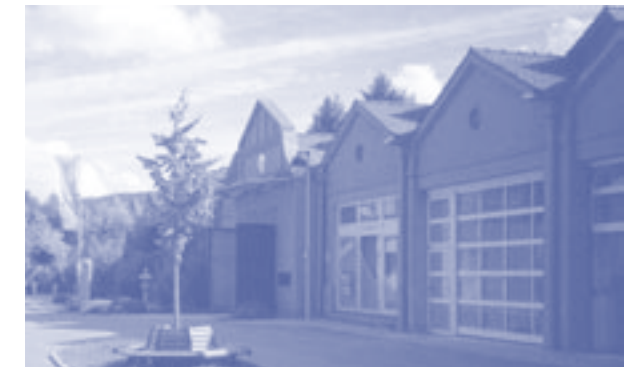
Foto: Ansiedlung von Kleinbetrieben in einer ehemaligen Gewerbebrache im „Kämmerle“, Rohrdorf (Gemeinde Rohrdorf)

Im Förderschwerpunkt „Arbeiten“ sollen bestehende Arbeitsplätze gesichert und neue geschaffen werden. Kleine und mittlere Unternehmen, die ihre Betriebsstätte erweitern, umsiedeln, neu bauen oder modernisieren wollen, können sich um eine ELR-Förderung bewerben. Die Förderung für privat-gewerbliche Projekte beträgt zwischen 7,5% und 15% der anrechnungsfähigen Kosten, maximal 250.000 EUR.